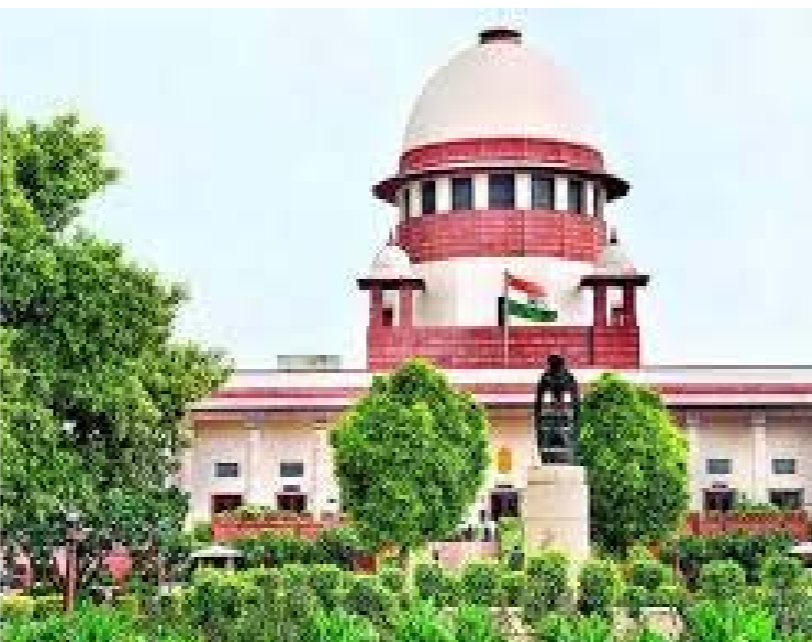
వాటిని చూడలేదని స్పష్టం చేశారు. సీసీఐ తరపు న్యాయవాది తుషార్ మోహతా జోక్యం చేసుకుంటూ, యూజర్ల సమాచారాన్ని అడ్వర్టయిజ్మెంట్ కంపెనీలకు షేర్ చేసే విషయంలో వాట్సాప్, మెటా దోషిడారు వైఖరితో అన్యాయంగా వ్యవహరిస్తున్నాయని ఆరోపించారు. యూజర్ల నుంచి నిర్దిష్ట అనుమతిని అందకుండానే వారి వ్యక్తిగత యాక్టివిటీలు, ఆసక్తుల సమాచారాన్ని సోషల్ మీడియా కంపెనీలు అమ్ముకోవడం నిరోధించాలని తుషార్ మోహతా కోరారు. డిజిటల్ పర్సనల్ డేటా ప్రాటెక్షన్ చట్టం ప్రకారం సోషల్ మీడియా యూజర్ల మెటా డేటా భద్రత కోసం నిర్దిష్ట మార్గదర్శకాలను ఇవ్వాలని సుప్రీంకోర్టుకు

విన్నవించారు. తుషార్ మోహతా వాదనతో సీజిబి జస్టిస్ సూర్యకాంత్ ఏకీభవిస్తూ రాజ్యాంగాన్ని పాటించలేకపోతే, దేశం విడిచి వెళ్లిపోవాలని వాట్సాప్, మెటాకు సవాల్ చేశారు. ఈ లిటిగేషన్లో భారత ఎలక్ట్రానిక్స్, ఇన్ఫర్మేషన్ టెక్నాలజీ శాఖను కూడా ఒక పక్షంగా చేరుస్తున్నట్లు వెల్లడించారు. సోషల్ మీడియా యూజర్ల మెటా డేటా భద్రతపై తగిన సూచనలను తమకు సమర్పించాలని ఎలక్ట్రానిక్స్, ఇన్ఫర్మేషన్ టెక్నాలజీ శాఖను సీజిబి ఆదేశించారు. ఈ అంశంపై వాదనలు ముగిసే వరకు యూజర్లకు సంబంధించిన ఏ సమాచారాన్నీ మెటా కంపెనీకి ఇవ్వద్దని వాట్సాప్ కు సుప్రీంకోర్టు బెంచ్ ఆర్డర్ ఇచ్చింది. సోషల్ మీడియా కంపెనీలు వాణిజ్య వ్యవహారాల వల్ల భారత పౌరుల ప్రాథమిక గోప్యతా హక్కుకు భంగం కలగరాదని తేల్చి చెప్పింది. డేటా షేరింగ్ పేరుతో భారత పౌరుల ప్రైవేసీ హక్కుతో అటలు ఆడటం సరికాదని పేర్కొంది. అన్యాయంగా వాట్సాప్ యూజర్ల సమాచారాన్ని ఇతరులకు షేర్ చేసేందుకు టెక్ కంపెనీలకు అనుమతి ఇచ్చేది లేదని దేశ సర్వోన్నత న్యాయస్థానం స్పష్టం చేసింది. టెక్ డిగ్గణ కంపెనీల ప్రైవేసీ షరతులు, నిబంధనలకు చాలా తెలివిగా రూపకల్పన చేశారని మండిపడింది. ఈ అంశంపై మళ్ళీ ఫిబ్రవరి 9న వాదనలు వింటామని, ఆ రోజునే మధ్యంతర ఆదేశాలను జారీ చేస్తామని ధర్మాసనం పేర్కొంది.