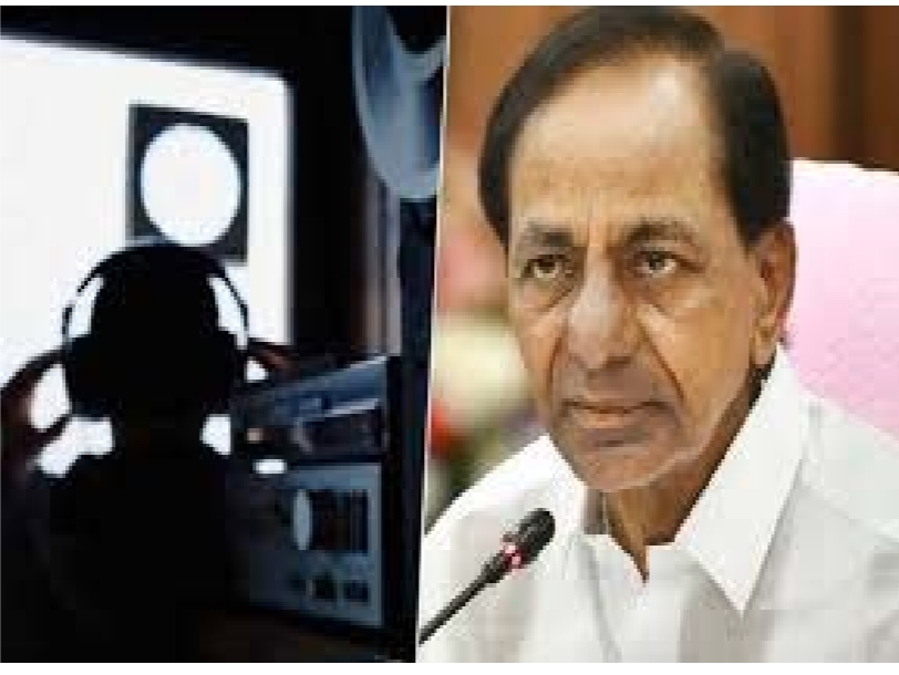
పరికరాల కొనుగోలు..? చేశారా అని నిట్ అధికారులు ప్రశ్నించినట్లు సమాచారం. ఈ విచారణలో మరో కీలక అంశం వెలుగులోకి వచ్చింది. ఫోన్ ట్యాపింగ్ పరికరాల కొనుగోలుకు పార్టీ ఫండ్ ను కేటాయించారా..? ప్రభుత్వ నిధులు కాకుండా పార్టీ డబ్బులు ఎందుకు ఉపయోగించారు..? అంటూ నిట్

తీశారు. ఏ సంవత్సరం నుంచి ఫోన్ ట్యాపింగ్ చేయమని చెప్పారు?, అది సాధారణ భద్రత కోసమా..? లేక రాజకీయ అవసరాల కోసమా..?' అంటూ పలు ప్రశ్నలు వేసినట్లు సమాచారం. ఎన్నికలకు ముందు ప్రతిపక్ష నేతల ఫోన్లు ట్యాప్ చేశారా..?.. వారి ఫోన్లు ట్యాప్ చేయమని ఆదేశాలు ఇచ్చారా..? అంటూ నిట్ అధికారులు నేరుగా ప్రశ్నించినట్లు తెలుస్తోంది. ఈ ప్రశ్నలపై కేసీఆర్ ఇచ్చిన సమాధానాలు ఈ కేసులో తమ దర్యాప్తును కీలకంగా మారనున్నాయని నిట్ అధికారులు భావిస్తున్నారు. ఇంటిలిజెన్స్ మాజీ చీఫ్ ప్రభాకర్ రావు వ్యవహారం కూడా నిట్ అధికారుల విచారణలో ప్రధాన అంశంగా మారింది. పదవీకాలం ముగిసిన ప్రభాకర్ రావుకు మళ్ళీ పదవీని ఎందుకు పొడిగించారు..? ఆ నిర్ణయం వెనుక కారణాలు ఏంటి..? అంటూ కేసీఆర్ ను నిట్ అధికారులు ప్రశ్నించినట్లు తెలిసింది. ఒకే వ్యక్తికి రెండు కీలక పోస్టులు ఎందుకు..? పరిపాలనా నియమావళికి విరుద్ధంగా ఒకే వ్యక్తికి రెండు కీలక బాధ్యతలు అప్పగించడంపై కూడా నిట్ అధికారులు ప్రశ్నలు సంధించారు. ఒకే వ్యక్తికి రెండు కీలక పోస్టులు ఎందుకు అప్పగించారు..?, అది ఫోన్ ట్యాపింగ్ వ్యవహారంతో సంబంధం ఉందా..? అనే కోణంలో నిట్ విచారణ కొనసాగినట్లు సమాచారం. ఎమ్మెల్యేల కొనుగోలు కేసు సమయంలో తీసుకున్న చర్యలపై కూడా నిట్ అధికారులు ప్రశ్నించినట్లు సమాచారం. 'మీ పార్టీ ఎమ్మెల్యేలు ఇతర పార్టీలకు వెళ్తున్నారని మీకు ఎలా తెలిసింది?, ఆ సమాచారం ఫోన్ ట్యాపింగ్ ద్వారానే వచ్చిందా..? అనే అనుమానాలతో అధికారులు ఆరా తీసినట్లు తెలుస్తోంది. పార్టీ ఫండ్ తో ఫోన్ ట్యాపింగ్